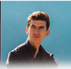
AlianțaUSR PLUS Alegeri Locale 2020 Helyi Választások 2020

AlianțaUSR-PLUS Covasna se pregătește de alegeri