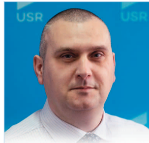
AlianțaUSR PLUS Alegeri Locale 2020 Helyi Választások 2020